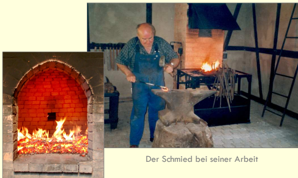
Der Schmied bei seiner Arbeit

Innerhalb des Agrarmuseums findet man, aufgebaut nach historischem Vorbild, das BACKHAUS mit dem Lehmbackofen, das RAUCHHAUS und die DORFSCHMIEDE mit einer Ausstellung von alten Werkzeugen und Maschinen.